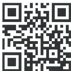
QR CODE ใบสมัครพนักงาน มหาวิทยาลัยเงินรายได้

ได้รับวุฒิปริญญาโทหรือ หรือคุณวุฒಿಯ่างอื่นที่เทียบได้ไม่ต่ำกว่านี้ ทางด้านการศึกษา จิตวิทยา ศิลปศาสตร์อักษร ศาสตร์ รัฐศาสตร์ คณิตศาสตร์ การวัดและประเมินผล สถิติ เศรษฐศาสตร์ การบริหารการจัดการ สังคมศาสตร์ สังคมสงเคราะห์ศาสตร์ สังคมวิทยา วารสารศาสตร์ วิทยาศาสตร์ หรือ สาขาวิชาอื่นที่เกี่ยวข้อง